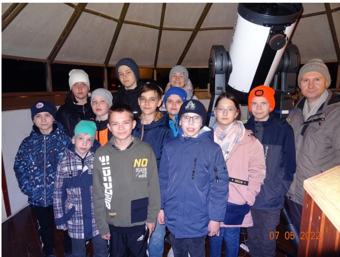
Дети на школьной экскурсии

На школьную экскурсию можно зарегистрировать группу до 10 детей. Этот вариант выбирают педагоги доп. образования или преподаватели школ, родительские комитеты. Ограничение по возрасту детей — до 16 лет. Вместе с ними обязательно должно быть 2 взрослых сопровождающих. На школьную экскурсию доступен один общий билет, стоимость 3000 р.